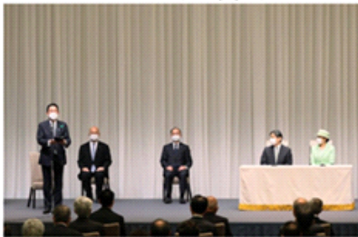
令和4年緑化推進運動功労者