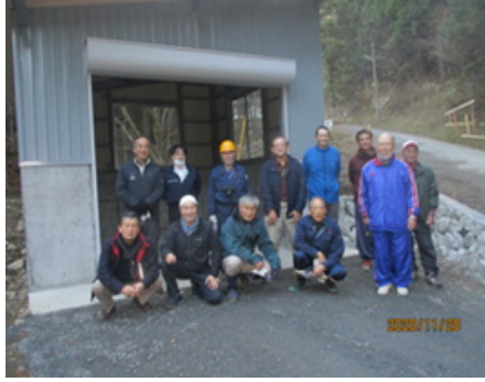
陽野ふるさと電力株式会社寺沢川発電所